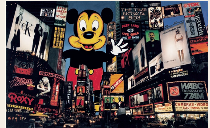
William Klein, Mickey takes over Times Square, New York, 1996, c-print. Courtesy Gallery FIFTY ONE.

Yayoi Kusama, Dots , 1999, gemengde techniek. Museum Voorlinden, Wassenaar.