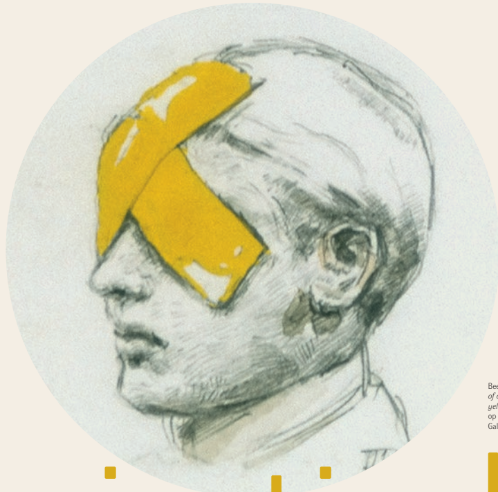
Beeld gebaseerd op: Michael Borremans, Various ways of avoiding visual contact with the outside world using yellow isolating tape , 1998, potlood en aquarel op karton. Foto: Felix Timy, Collection Tim Van Laere Gallery, Antwerp. Courtesy Zeno X Gallery, Antwerp.

Alles om ons heen tintelt en zindert. Digitale schermen lichten op. Neuronen knetteren onder de hersenpan. Zintuigen raken overweldigd.